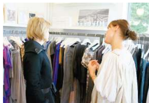
Rådgivningen af kunderne spiller en afgørende rolle i den eksklusive modebutik i Espergærde.

forretningens atmosfære, indretning, kollektioner og accessories," hedder det på forretningens hjemmeside, www.ifigenia.dk