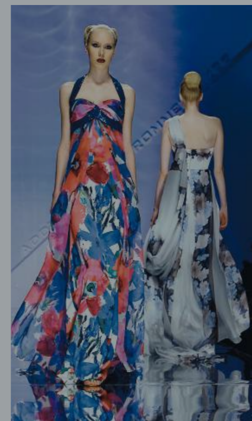
Hidsige farver og blomsterbørn er dette års modetema.

Skal det være sommer, så lad det være sommer, må designerne næsten have tænkt i kor. Gul i alle afskygninger bliver nemlig sæsonens helt store modifarve sammen med en stærk koralrod.